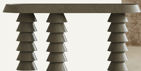
Trigono konsolbord af Studio Anansi, 101.608 kr. (Love House).