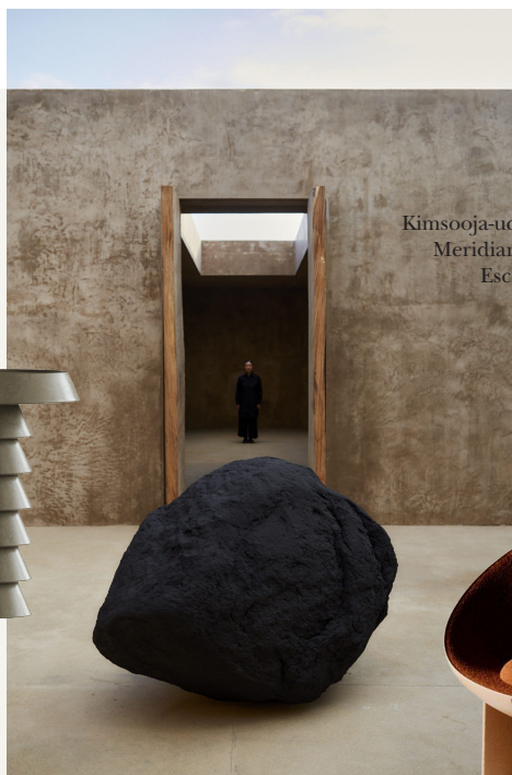
Kimssooja-udstilling på det nyåbnede Meridiano Art galleri i Puerto Escondido, Mexico.