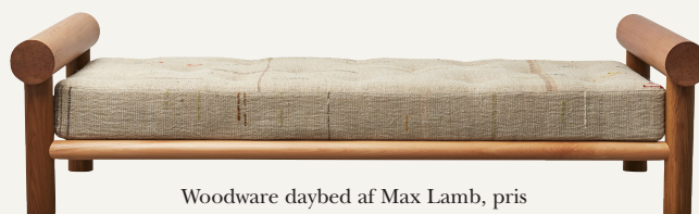
Woodware daybed af Max Lamb, pris på forespørgsel (Gallery Fumi).