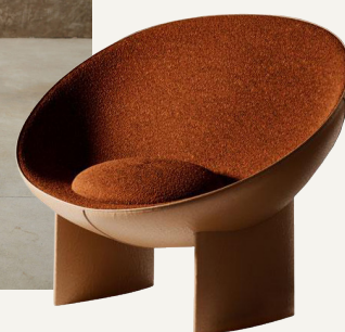
Mekong lænestol af Elisa Ossino, pris på forespørgsel (Trussardi Casa).