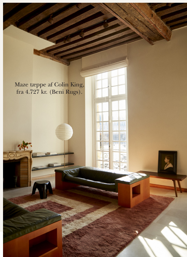
Maze tæppe af Colin King, fra 4.727 kr. (Beni Rugs).